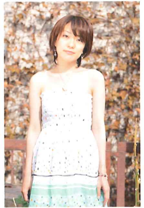
彩 -aya- Official Website 『唱の雨』