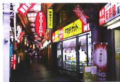
① チケット売り場が第一の目印

JR 京橋駅北口改札を右に出て（宝くじ売り場側）、「京阪商店街南通し」に入って下さい。